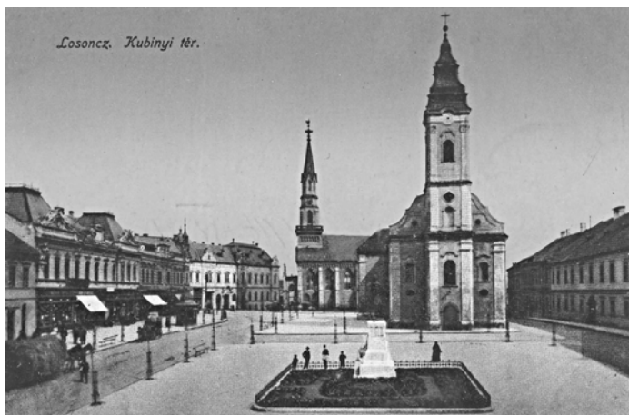
Losonc. Kubinyi tér.

Rímskokatolícky barokovo-klasicistický kostol na Kubínyho námestí v Lučenci bol postavený na počesť Navštívenia Panny Márie v roku 1783. Dnešnú podobu získal v roku 1792, obnovený bol v rokoch 1850 a 1895. Spočiatku to musel byť len provizórny stánok, pretože sa nekonkretizuje ani v kanonickej vizitácii (inšpekcia) z roku 1784 a nespomína ho ani Korabinského lexikón z roku 1786. Pozemok na stavbu kostola poskytol v roku 1772 Pavel Balassa (8 siah široký, 16 siah dlhý a 4 siahy pre vežu). Katolíci neboli spokojní s vyznačeným miestom pre stavbu kostola (v rade domov vedľa katolíckej fary), preto bolo podľa ich žiadosti z roku 1772 vymerané v decembri 1776 nové miesto na vtedajšom trhovisku (8x16 siah = cca 15x30 m a 4 siahy pre vežu = cca 7x7 m). 13. marca 1776 bulou pápeža Pia VI. Apostolatus officii bolo založené rožňavské biskupstvo, ku ktorému boli z Novohradu pričlenené obvody Filakovo, Halič a Lučenec.